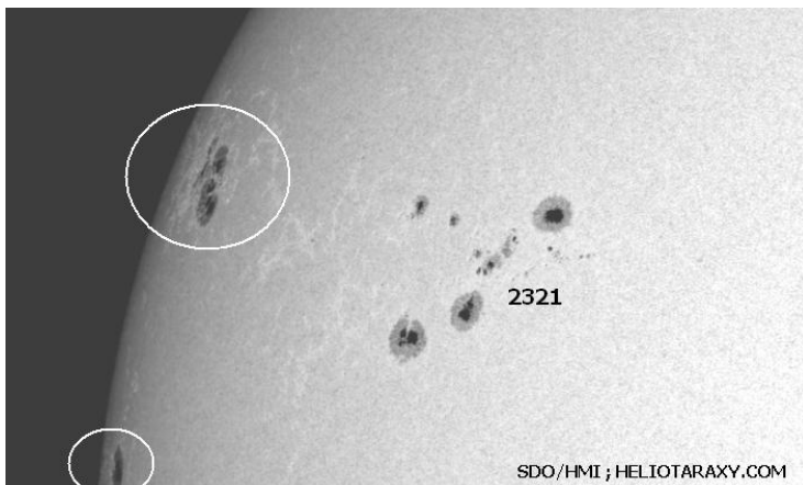
Североизточният край на слънчевия диск на 14 април 2015г

През изминалото денонощие слънчевата активност беше ниска . Имаше няколко изригвания от слабия мощностен клас С. Най-значителното от тях (С4.7) стана в района на групата петна 2322 вчера около 11ч30мин българско време. През последното денонощие не са наблюдавани изхвърляния на коронална маса (СМЕ) по посока на Земята. "Базисното" ниво на слънчевия рентгенов поток е около В8.