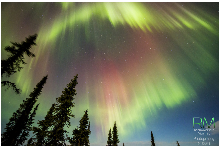
Северно полярно сияние (Aurora Borealis) над Фейърбанкс (Аляска)

В рамките на 3-дневната прогноза (11-13 ноември) потокът на слънчевите протони с висока енергия ( E > 10 \text{ MeV} ; СЕЧ) на геостационарна орбита ще бъде около обичайния фон. Вероятността за радиационна буря засега се приема за малка.