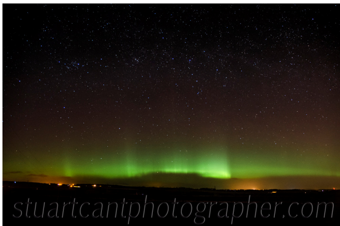
Атмосферно сияние над Шотландия на 17 февруари 2015г (снимка: Стюарт Кент) (solarham.net)

През последното денонощие геомагнитната обстановка беше спокойна в среднопланетарен мащаб. Геомагнитни смущения имаше над отделни райони на Земята. Над някои полярни и субполярни области е наблюдавана и аврорална активност . Над България геомагнитната обстановка остана спокойна.