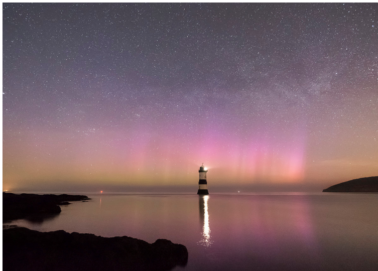
Сияние над Уелс (Великобритания) през нощта на 9 срещу 10 април 2015г

През последното денонощие геомагнитната обстановка достигна до ниво на планетарна геомагнитна буря със средна мощност (G2) (***!!!***) . Късно през нощта между 3ч и 6ч българско време планетарният 3-часов Кр-индекс достигна бал 5 (малка буря). През следващите три часа той достигна бал 6 (средна буря), а между 9ч и 12 (българско време отново слезе на бал 5. Над полярните и субполярни райони на Земята през нощта бе наблюдавана аврорална активност . Над България геомагнитната обстановка на два пъти (вчера около обяд между 12ч 15ч и днес рано сутринта между 6ч и 9ч) беше смутена.