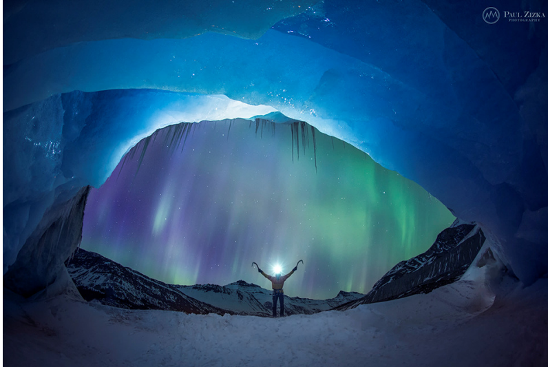
Сияние над района на "Ледената пещера" в провинция Алберта (Канада) от 10 април 2015г. Снимката е от "монтажен" тип

Потокът на слънчевите протони с висока енергия ( E > 10 \text{ MeV} ; СЕЧ) на геостационарна орбита беше близо до обичайния фон.