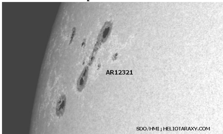
Групата петна AR12321(2321) на 12 април 2015г

През изминалото денонощие слънчевата активност беше ниска . Имаше 5-6 изригвания от слабия клас C. Повечето от тях станаха в новата активна област AR12321 (2331) близо до североизточния край на слънчевия диск. Най-значимото измежду изригванията (с мощностен показател C3.9) стана късно през нощта около 03ч30мин българско време в областта 2320. През последното денонощие не са наблюдавани изхвърляне на коронална маса (CME) по посока на Земята. "Базисното" ниво на слънчевия рентгенов поток е около B7-B8.