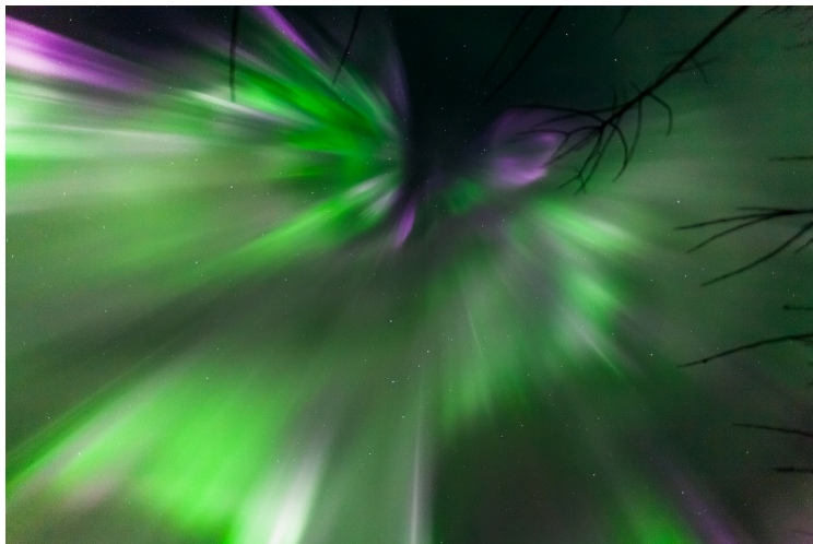
Северно поляпно сияние (Aurora Borealis) над Аляска

През последното денонощие геомагнитната обстановка беше активна и общо в продължение на шест часа беше на ниво на малка планетарна геомагнитна буря (Kp=5; G1) (***!!!***) . Над полярните области на Земята през последните две денонощия се наблюдава значителна аврорална активност . Над България геомагнитната обстановка беше смутена вчера следобяд (за станция Панагюрище K=4) в продължение на шест часа.